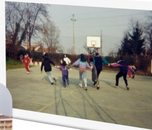
Il campo di basket e pallavolo