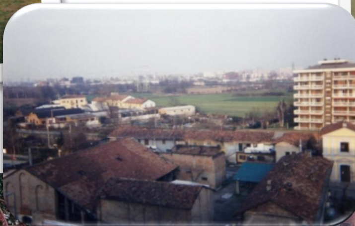
Vista "Stalla Cattedrale"