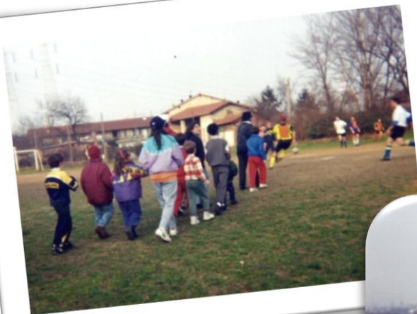
Il campo di calcio