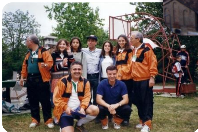
La 1° squadra di pallavolo femminile