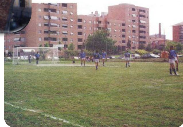
I primi tornei CSI